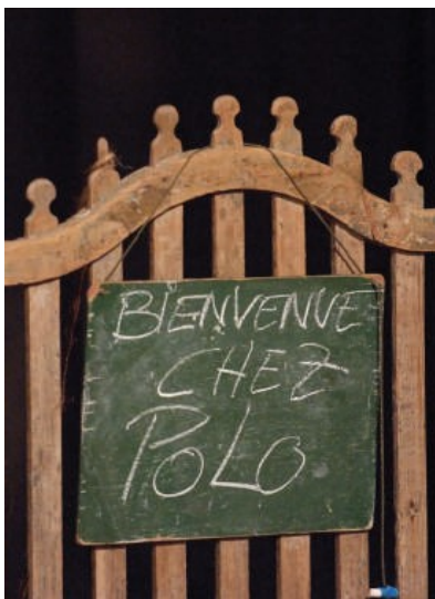
«Le jardin à roulettes»